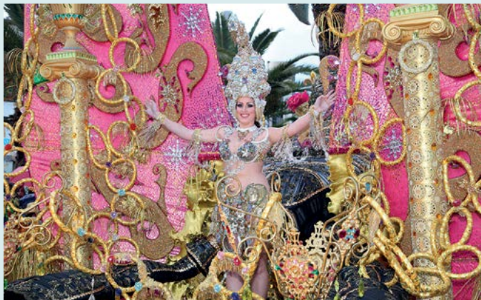
Karnawał w Santa Cruz de Tenerife

To największy tunel wulkaniczny w Unii Europejskiej. Podczas wycieczki z przewodnikiem można zwiedzić fragment jaskini i obejrzyć zadziwiające formacje skalne (zob. s. 74).